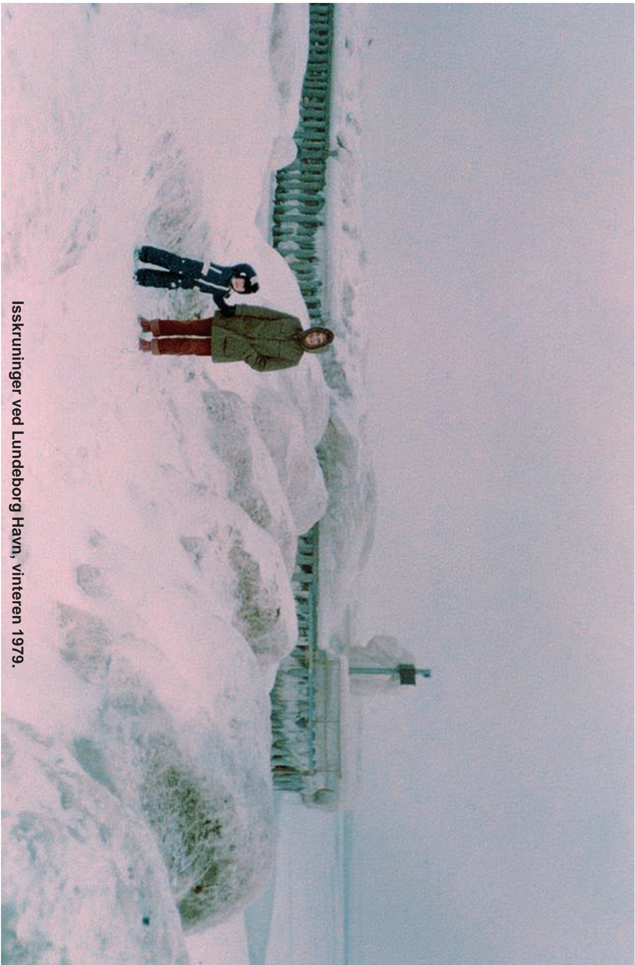
Isskruninger ved Lundeberg Havn, vinteren 1979.