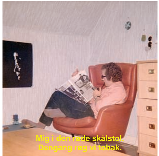
Mig i den røde skålstol. Dengang røg vi tobak.