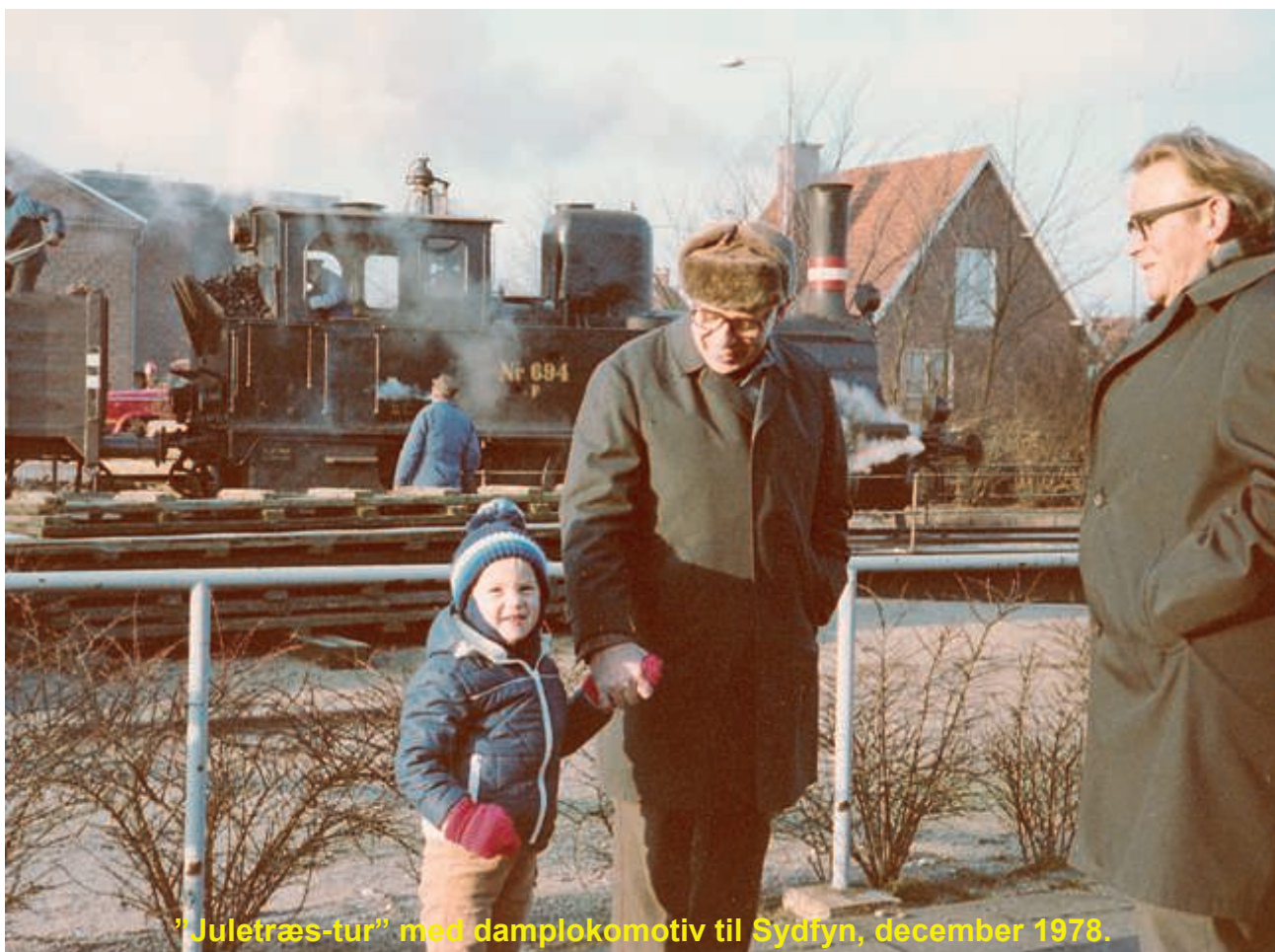
"Juletræs-tur" med damplokomotiv til Sydfyn, december 1978.

1979 blev et helt almindeligt år uden de store udsving.