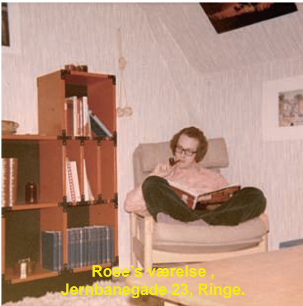
Rose's værelse, Jernbanegade 23, Ringe.