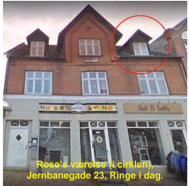
Rose's værelse (i cirklen), Jernbanegade 23, Ringe i dag.