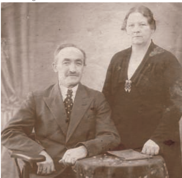
Morfar og mormor.

Desværre blev min morfar syg. Min mor sagde, det hed mavesår, og det kunne lægerne ikke helbrede, dengang.