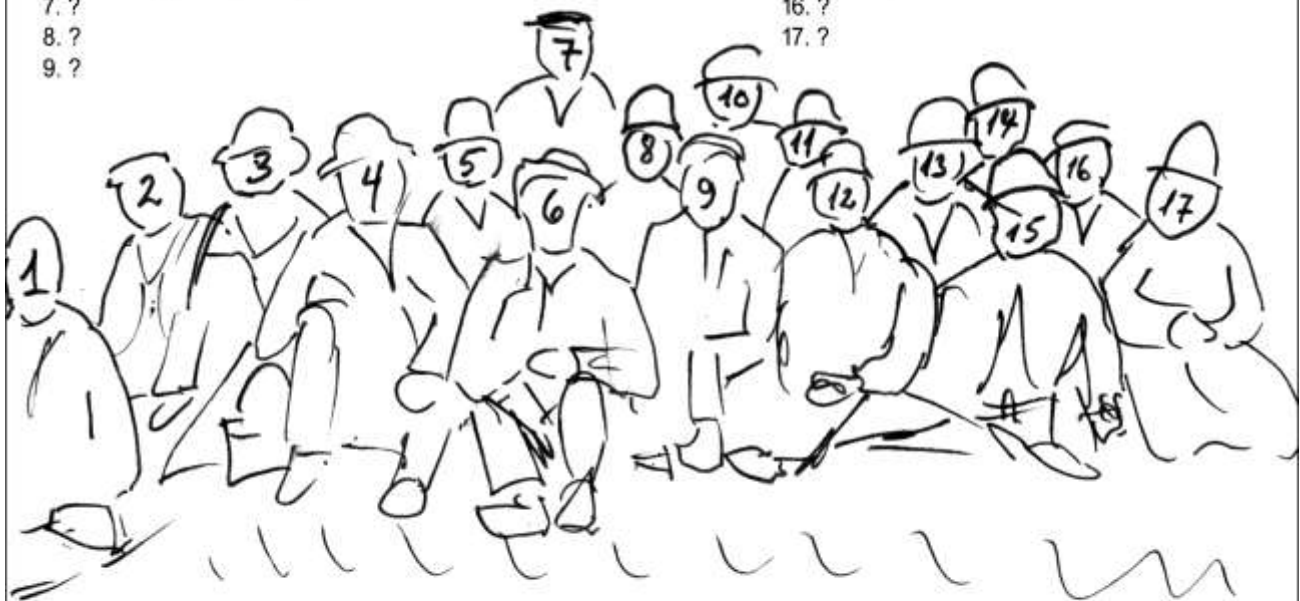
Ryslinge Brugsforeninges bestyrelse på udflugt 19??