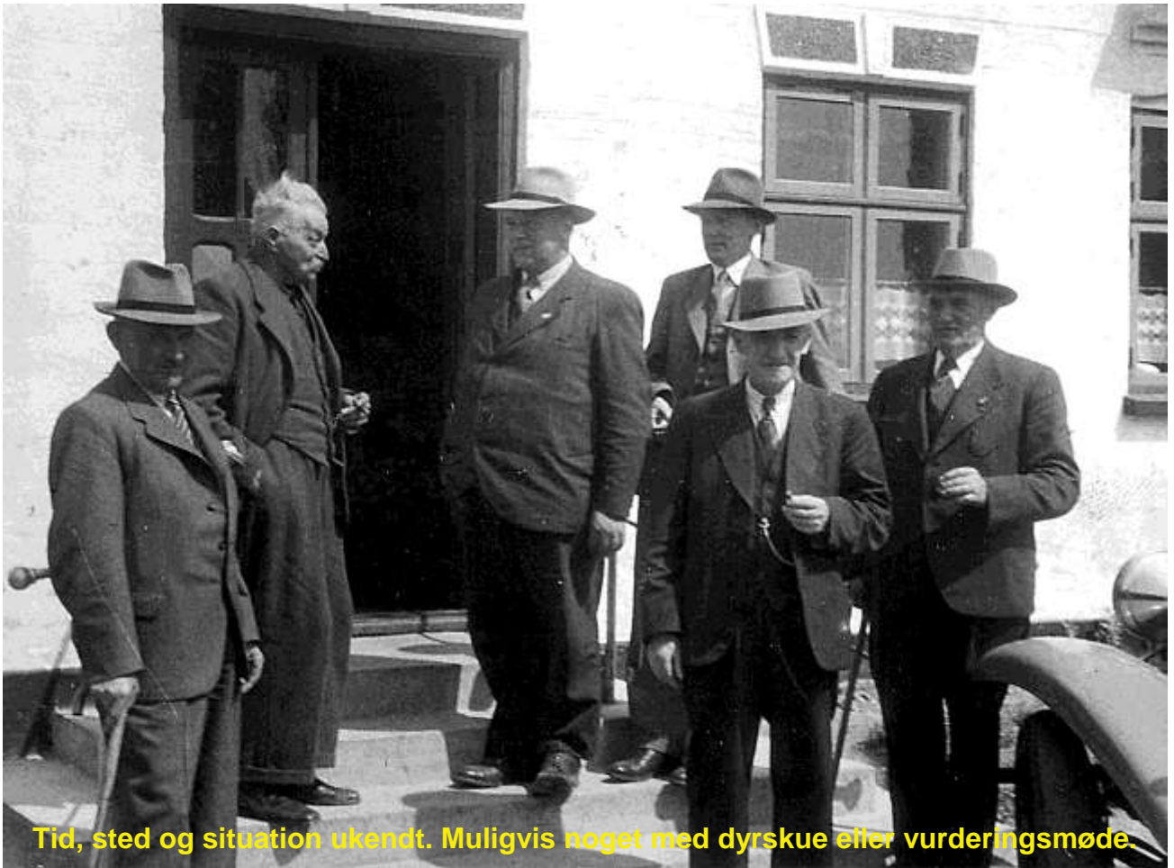
Tid, sted og situation ukendt. Muligvis noget med dyrskue eller vurderingsmøde.