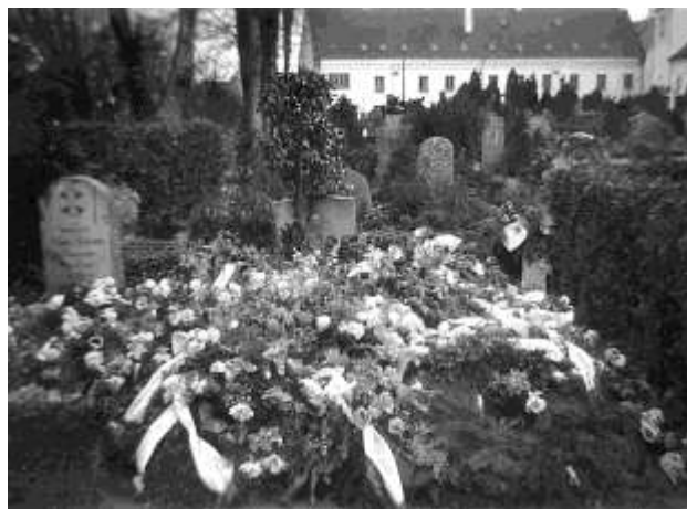
Morfars grav på Ryslinge Kirkegård.