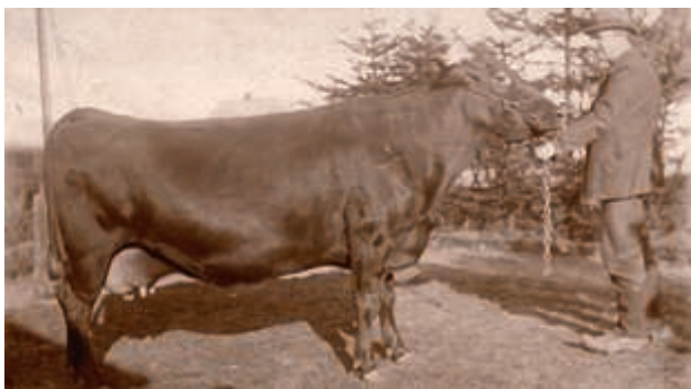
Morfar med en præmieko (måske).

En anden meget væsentlig beskæftigelse var arbejdet som vurderingsformand i Sunds-Gudme Herred. Man vurderede folks ejendom, både selve ejendommen og den tilhørende jord, så skattemyndighederne havde noget at "ligne" = (skatteansætte) ud fra.