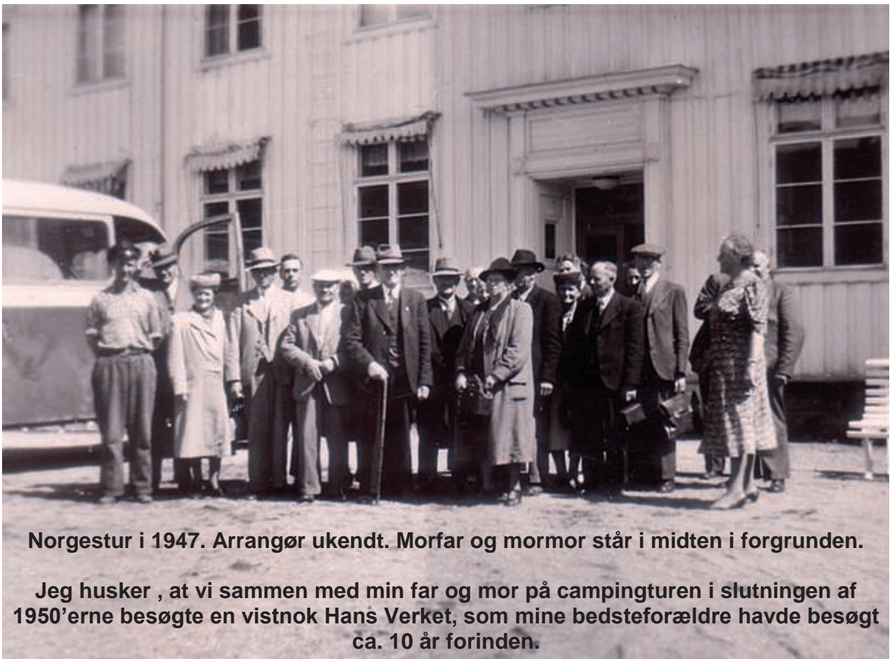
Norgestur i 1947. Arrangør ukendt. Morfar og mormor står i midten i forgrunden.