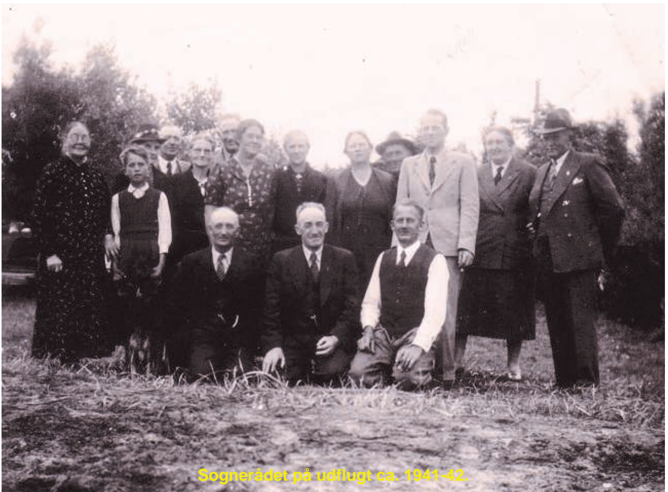
Sognerådet på udflugt ca. 1941-42.