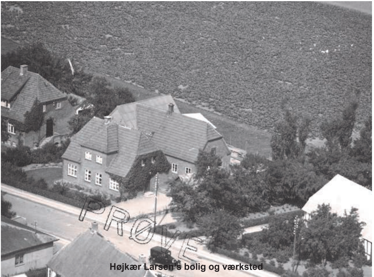
Højkær Larsen's bolig og værksted