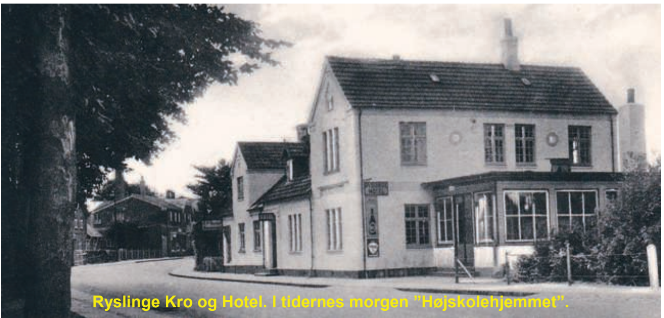
Ryslinge Kro og Hotel. I tidernes morgen "Højskolehjemmet".