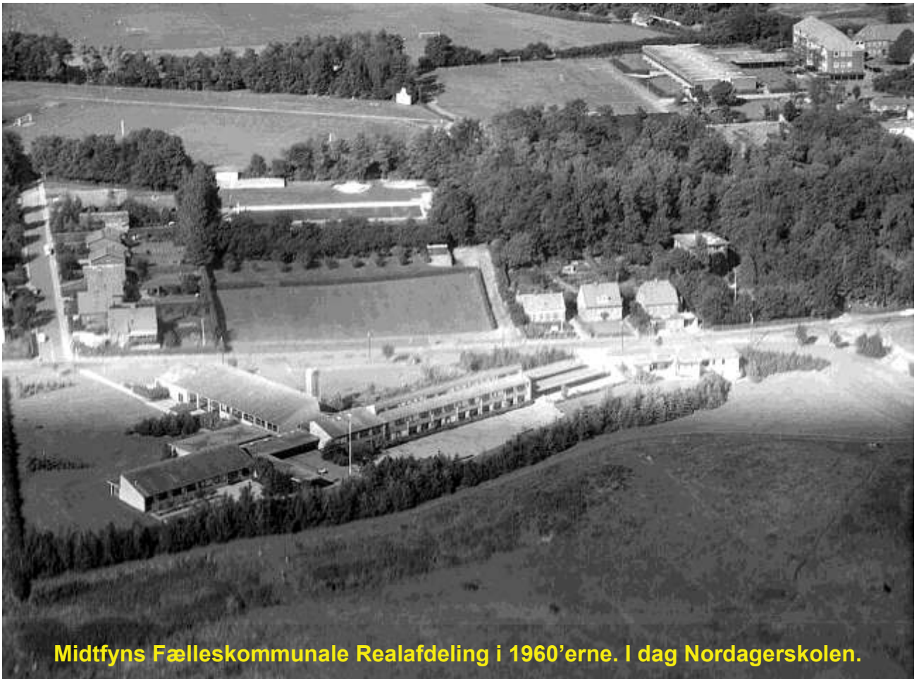
Midtfyns Fælleskommunale Realafdeling i 1960'erne. I dag Nordagerskolen.