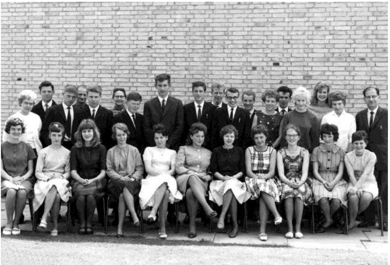
Midtfyns Fælleskommunale Realafdeling, 3.b i 1964. Færdig med 3 års skolegang.