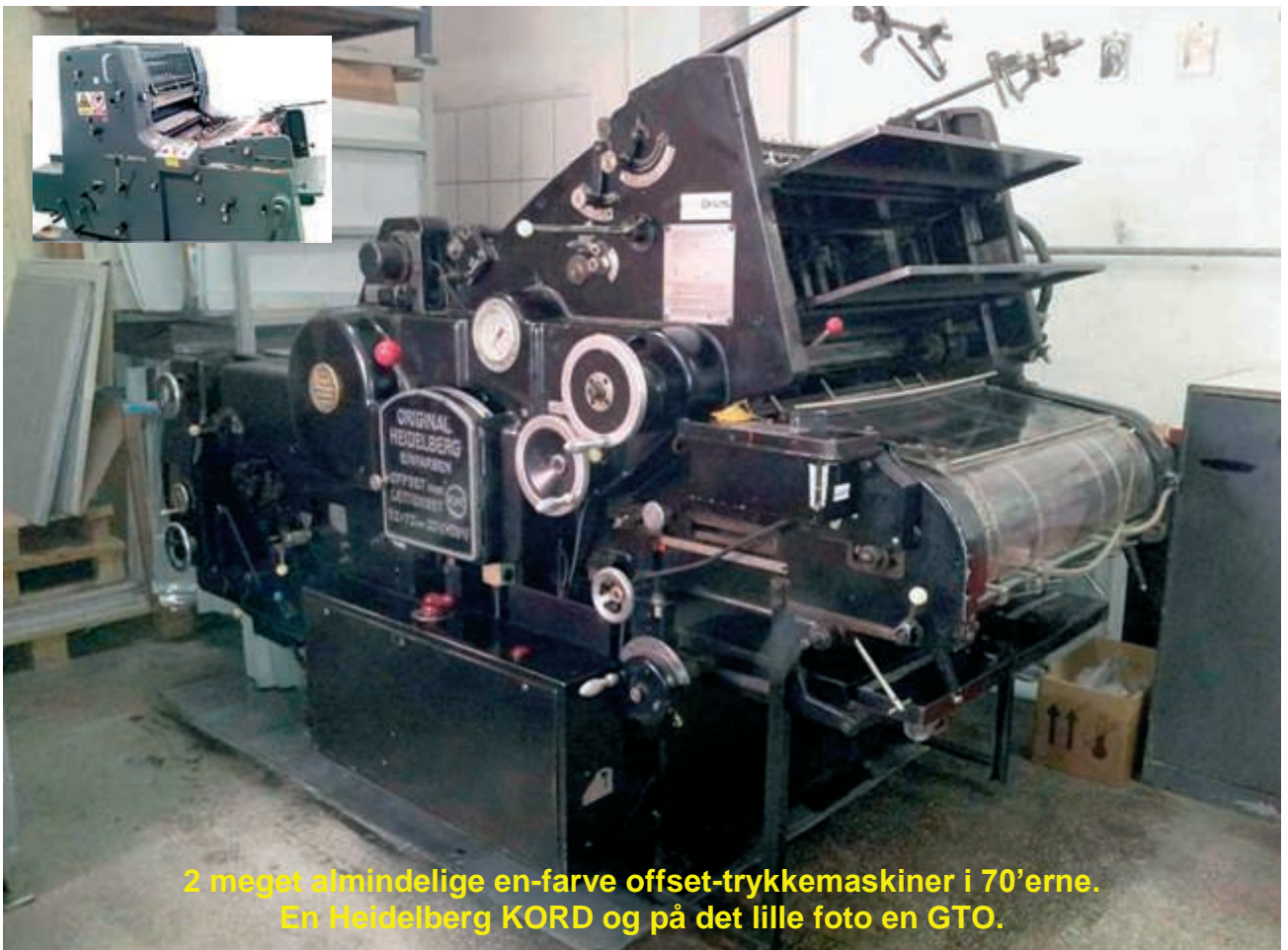
2 meget almindelige en-farve offset-trykkemaskiner i 70'erne. En Heidelberg KORD og på det lille foto en GTO.