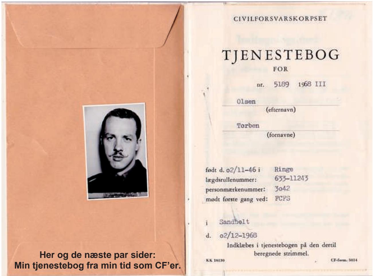
Her og de næste par sider: Min tjenestebog fra min tid som CF'er.