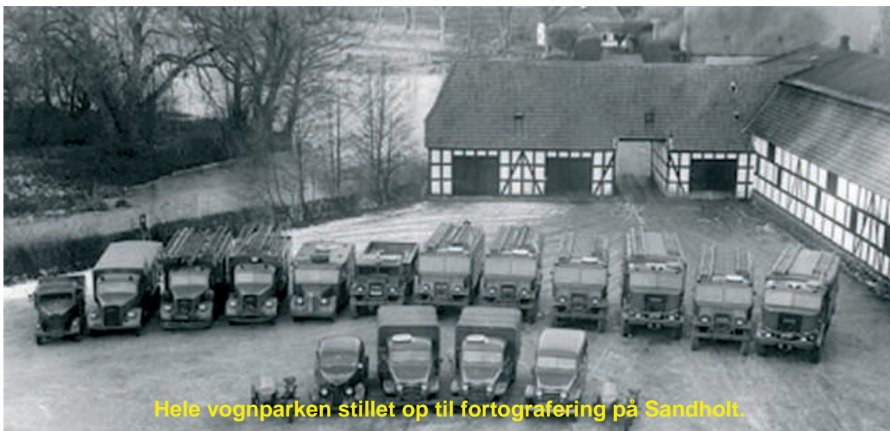
Hele vognparken stillet op til fortografering på Sandholt.

En kold decembermorgen mødte man så op på Sandholdt. De følgende 5 måneder gennemgik vi en grunduddannelse i brandslukning og redningsteknik, hvor man, i tilfælde af krig, skulle hjælpe befolkningen med brand- og redningsaktioner.