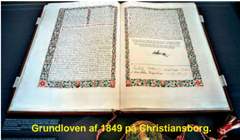
Grundloven af 1849 på Christiansborg.