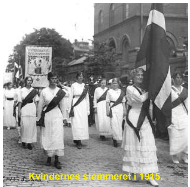
Kvindernes stemmeret i 1915.